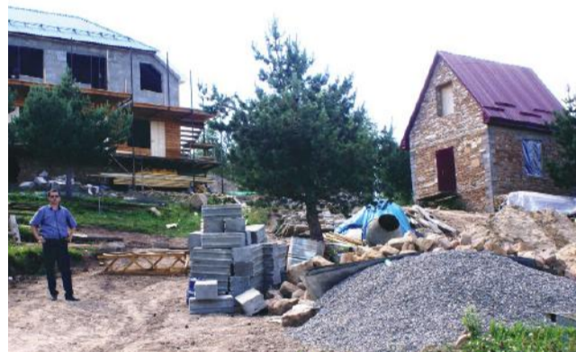
Суракъатица туристазе балев бакІ

Щибаб къоялъ радал сагІат щугоялдасан нахъе гъелъул чІараб-гархъараб заман букІунарилан бицана. Жакъа къоялде щвезегІан жинцаго бецун, мугъаль баччун, данде гъабун буго 15-16 тонна харил. Свак абураб жо лъалебго гъечІоан ГІайшатида. Шагъаралда ругел шартІаздасан къураб жо щибго гъечІоан гъелъул мина-къаялъулги. КъваригІараб бакІалдеги ине буго жийго бетІергъанаб машина.